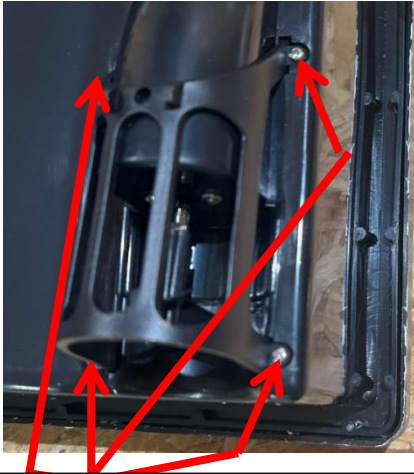
Retirer ces 4 vis sur les 2 grilles du bateau

Montage des tuyères : Pour monter les tuyères, il faut retirer les 4 vis de la grille de protection comme ci-dessous :