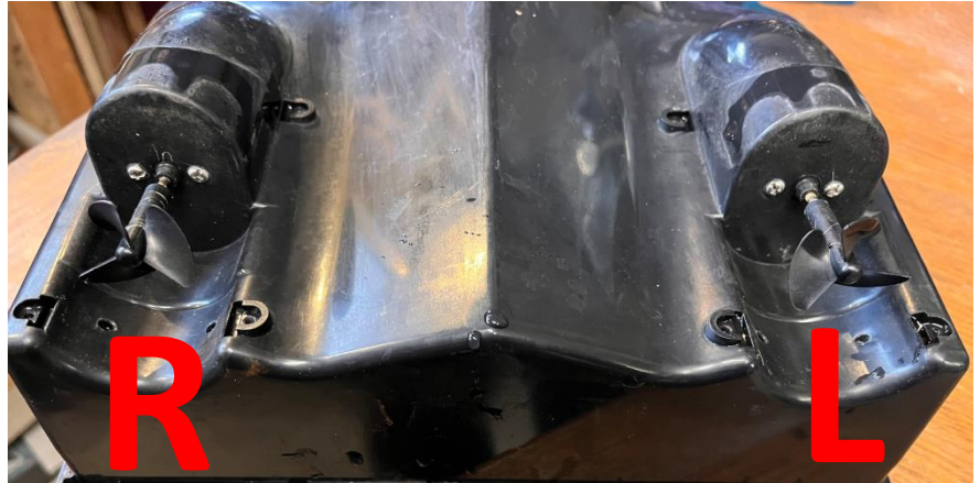
Retirer les 2 hélices du bateau (chauffer légèrement au sèche-cheveux les axes des hélices

- Mettre en place les nouvelles hélices. ATTENTION il y a une gauche (L) et une droite (R). Voir les lettres sur la photo ci-dessus.